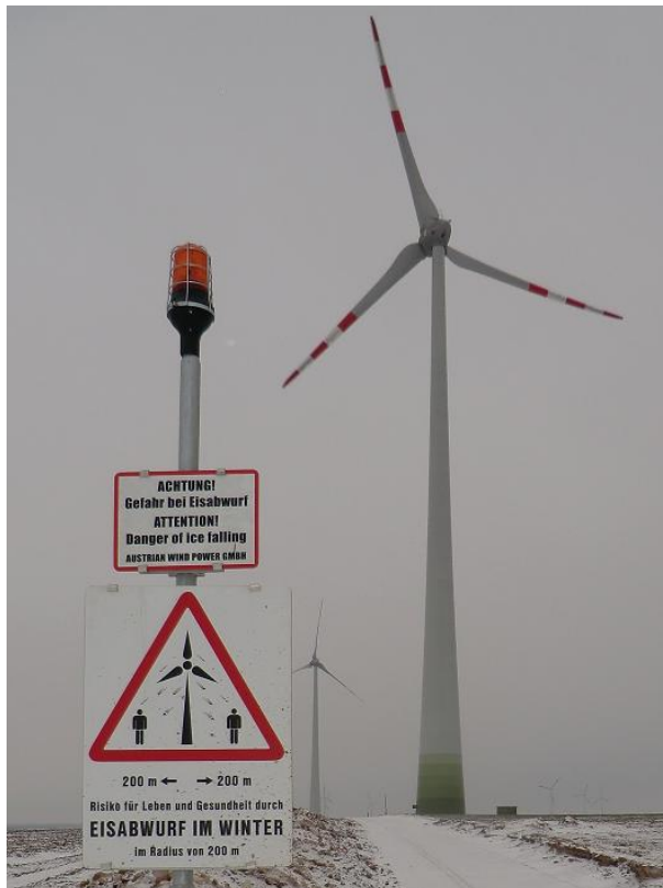
Abb. 1: Möglicher Aufbau einer Eiswarnleuchte mit zusätzlichen Warnschildern

Die Eiswarnleuchte ist so auszuführen, dass sie aus allen Richtungen gesehen werden kann. An die Steuerung der Windenergieanlage können mehrere Eiswarnleuchten angeschlossen werden. Durch die Anschlussmöglichkeiten und die Ausgangsleistung (Kap. 5, S. 8) wird die maximale Anzahl der anschließbaren Eiswarnleuchten begrenzt.